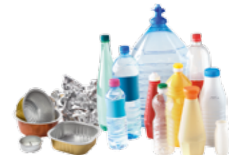
Carton, acier, aluminium, bouteilles plastique...