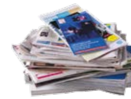
Papiers, journaux, magazines...