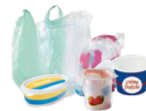
Petits emballages, sacs plastique...

//////////////////// Dans le bac jaune, tous les emballages et tous les papiers ! //////////////////////